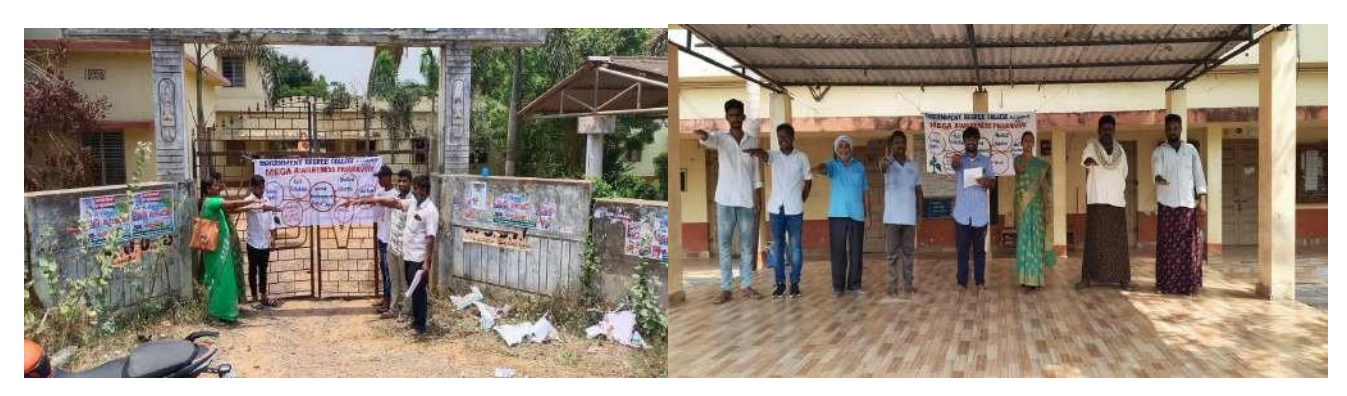
ENVIORNMENT DAY OATH