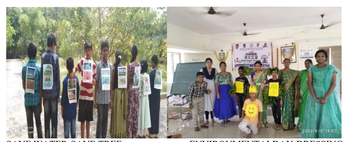
SAVE WATER-SAVE TREE